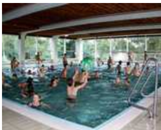
Foto Download unter:

http://www.linzag.at/content/show.php3?id=62&nodeid=201&_language=de&_language=de , am 22.10.2007.