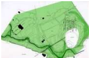
Parkanlage mit Urnenhain (weisser Fleck); Foto auf URL: http://www.artec-architekten.at/project.html?id=48

Der Erholungspark Urfahr-Heilham ist im Volksmund als Urnenhain bekannt. Der Waldfriedhof mit seinen 92.000 m 2 zählt zu den schönsten Friedhofsanlagen, die auch zu Spaziergängen einlädt. 2003 wurde der Neubau des Urnenhains Urfahr seiner Bestimmung übergeben. Im Park befindet sich auch das Wasserwerk Heilham, das 1902 zur eigenen Wasserversorgung von Urfahr errichtet wurde. Die alten Brunnenbauwerke wurden unlängst generalsaniert, die alten Brunnen zugeschüttet und neue errichtet.